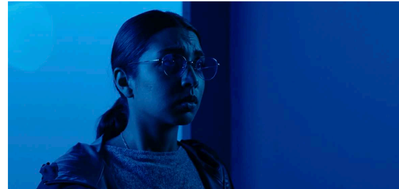
DIGITAL RELICS (16', Fantascienza, UK, 2020)