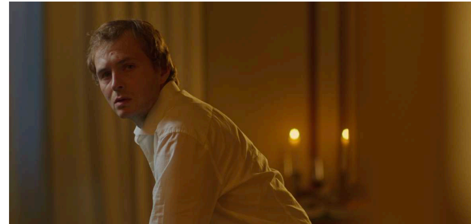
LO SGUARDO (25', Commedia, Dramma, Regno Unito-Italia, 2022)

| produttore, sceneggiatore, regista, montatore