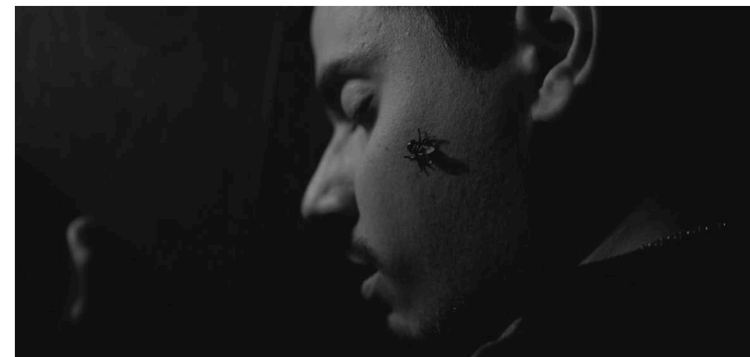
DIE MOTHERFUCKER DIE! (3', Commedia, Thriller, UK, 2019)