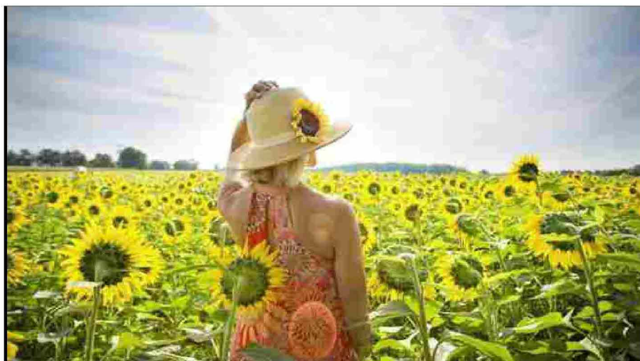
Anche la Maremma in vetrina