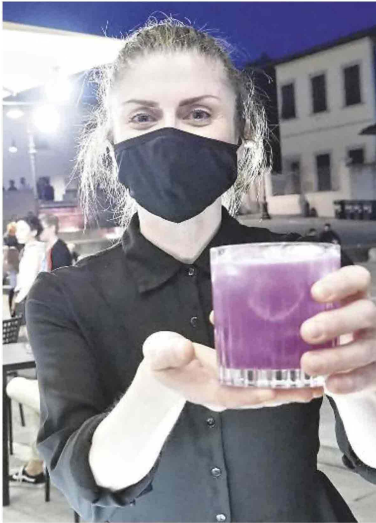
Quest'estate si può riscoprire la Toscana: ecco la guida a tutti gli appuntamenti