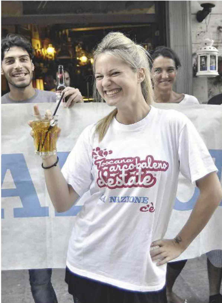
Oltre alla festa Arcobaleno d'Estate, ecco un'altra iniziativa per i nostri lettori