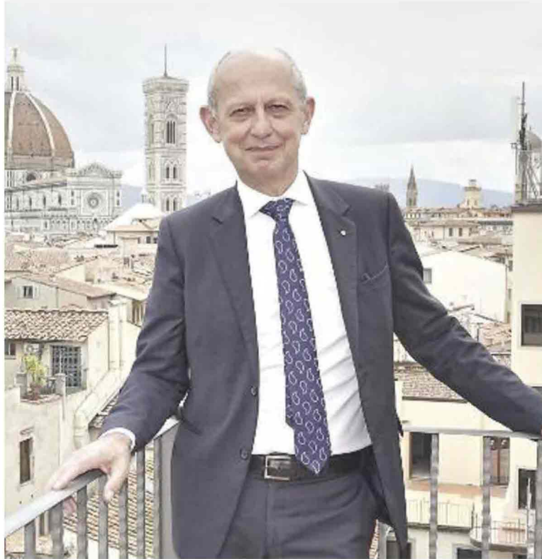
L'assessore regionale al turismo Stefano Ciuoffo