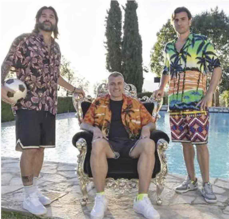
Adani, Vieri e Ventola: tre amici e tre grandi campioni sul set del video girato in Calvana