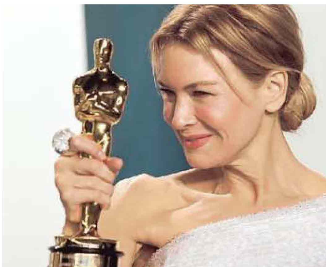
Renée Zellweger con la statuetta

Quella degli Oscar non è la sola cerimonia ad aver subito sconvolgimenti. L'edizione numero 74 dei Tony Award (gli Oscar del teatro) prevista per lo scorso 7 giugno è stata rimandata ed ancora in attesa di una nuova data. Si parla addirittura di cancellarla del tutto. Indecisa invece la sorte della settantaduesima edizione dei Primetime Emmy Award e dei Creative Arts Emmy Award, rispettivamente sono previste il 20 settembre e il 12 e 13 settembre, ma gli organizzatori non hanno ancora deciso se saranno in presenza o in modo virtuale. —