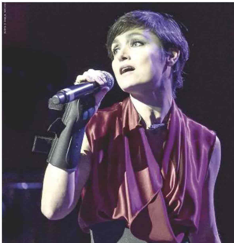
Petra Magoni sarà la star dell'Arcobaleno d'estate in Versilia