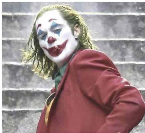
In alto una scena tratta dal film «Cena con delitto». Accanto «Joker» diretto da Todd Phillips