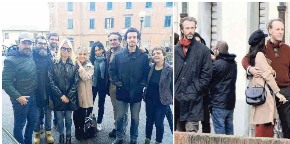
In alto le comparse livornesi che hanno girato nel primo ciak di "Andrà tutto bene" del regista Francesco Bruni; accanto l'attore Kim Rossi Stuart col regista livornese