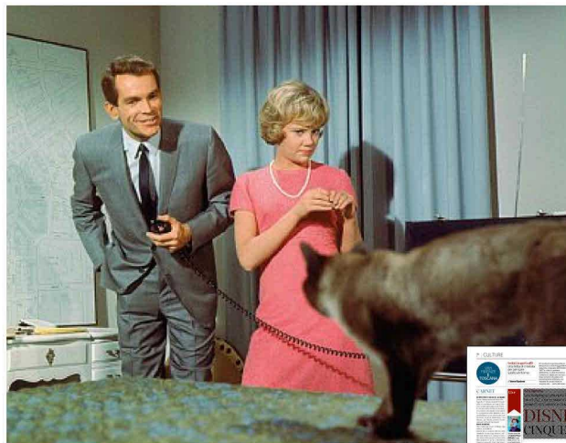
Una scena del film «F.B.I. Operazione Gatto» di Robert Stevenson (1965)

Da vedere La locandina originale del film Disney «The Parent Trip» («Il cowboy con il velo da sposa») di David Swift (1961)