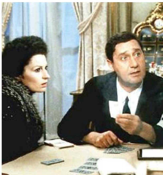
La celebre scena de «Lo scopone scientifico» con Alberto Sordi e Silvana Mangano

NATALE a Spaziouno. Fra gli jedi e i cinepanettoni – e cineavvanzi – sparsi nelle altre sale, ci si può anche far tentare da una proposta sfiziosa tra classici, musical napoletani e commedie francesi.