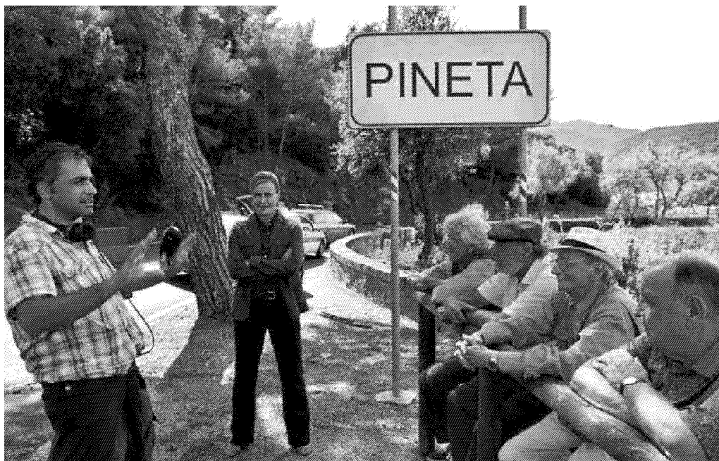
Un momento delle riprese dei Delitti del Barlume a Marciana Marina