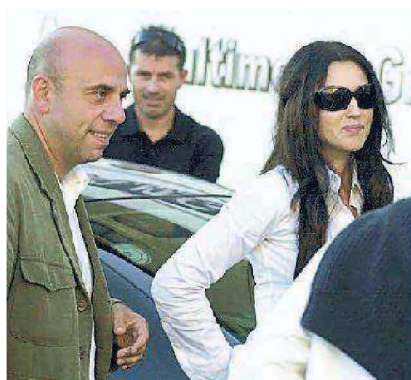
Virzì in piazza Bovio con Monica Bellucci e, a destra, il regista sul set di Marina