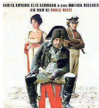
La locandina di “N”