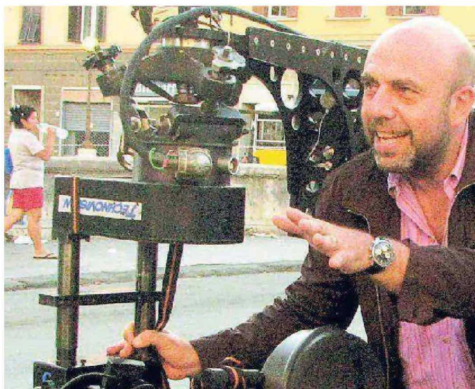
Il regista Paolo Virzì