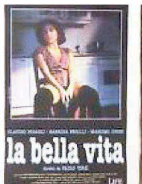
La locandina de “La bella vita”

Quella girata a Piombino dovrebbe essere, tra l'altro, la scena che chiuderà le riprese del film, che uscirà presumibilmente nel corso del 2018. Nell'attesa, i fan del regista livornese potranno godersi “Ella & John - The Leisure Seeker”, diretto da Virzì con due mostri sacri della recitazione come Helen Mirren e Donald Sutherland , presentato a Venezia e in sala dal 18 gennaio.