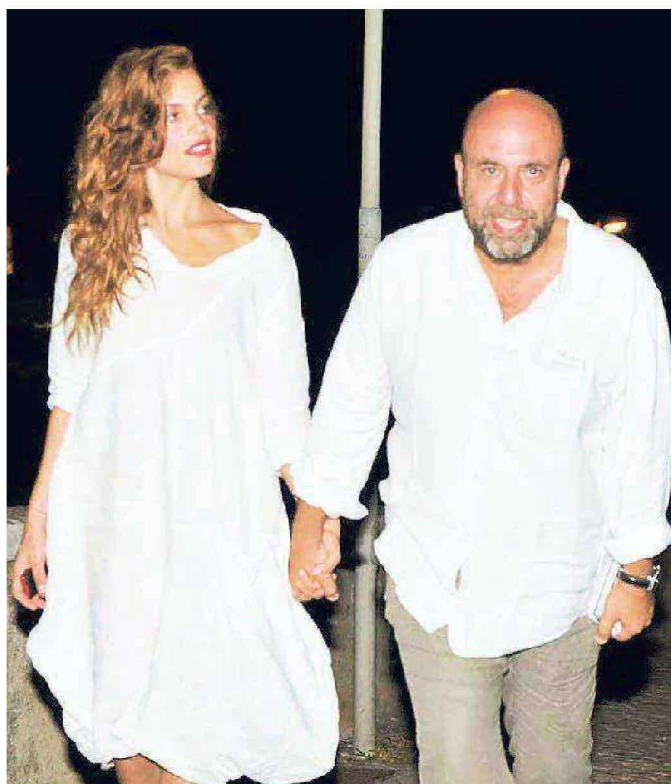
Virzi con la moglie, Micaela Ramazzotti, al "Pro Patria" nel 2010