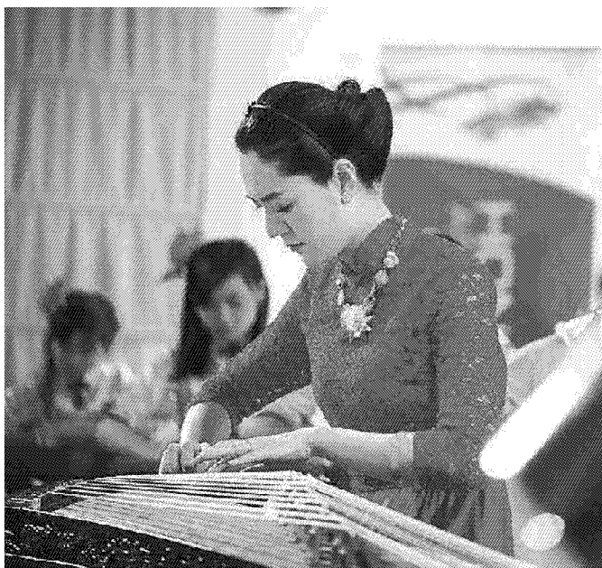
Si è concluso al Museo del Tessuto il Dragon Film Festival

Buona la terza. Il Dragon film festival, rassegna della cinematografia prodotta in Cina continentale, Honk Kong e Taiwan, per il terzo anno consecutivo si è tenuto a Prato, nella sede del Museo del Tessuto. Una manifestazione che è stata presentata in anteprima a Prato e si è svolta in contemporanea al cinema la compagnia di Firenze, ma proprio nella città laniera ha avuto il maggior riscontro di pubblico orientale. Crescente il coinvolgimento della comunità cinese, un dato di rilievo e in costante aumento delle ultime tre edizioni. La partecipazione alla rassegna è stata un modo per riscoprire le radici culturali cinesi per le seconde e terze generazioni oramai italiane a tutti gli effetti. Cinema, letteratura e musica hanno animato le serate del festival, 100 bambini cinesi si sono divertiti alla ricerca della cultura dei loro avi, tra musica tradizionale cinese — eseguita dalla scuola Jing Ying Jiao Yu di Prato — e visione del film Where is the dragon , simpatica pellicola dedicata alle creature dello zodiaco cinese. Tra i titoli presentati e che hanno più colpito gli spettatori c'è di sicuro l'opera Little Big master del regista Adrian Kwan e della sceneggiatrice Hanna Chang, storia vera di un'insegnante e della sua battaglia per salvare un piccolo asilo e le sue cinque alunne, candi-