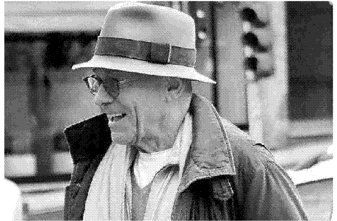
Il regista Andrej Koncalovskij in città