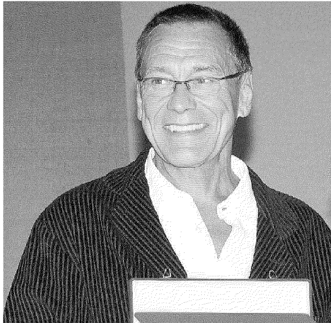
Il regista Andreji Konchalovskij

Per questo la Jean Vigo Italia sta selezionando attori non professionisti da inserire come protagonisti nel film del regista russo, autore di film come "Tango e Cash", "Lo schiaccianoci 3D" e vincitore nel 2016 del Leone d'Argento al cinema di Venezia con la pellicola "Paradise". In particolare lo street casting sta cercando figure per il ruolo principale, ma anche comparse con requisiti molto particola-